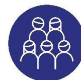
Cymru o Gymunedau Cydlynus