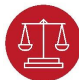
Cymru Fwy Cyfartal