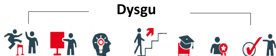
Hyfforddi Addysgu Datblygu Gwybodaeth Sgiliau Profiad Dysgu

Mae dyheadau yn freuddwydion, gobeithion, neu uchelgeisiau i gyflawni nod bywyd. Gellir meddwl amdanynt fel nodau bywyd trosfwaol a all helpu i ddarparu ymdeimlad o bwrpas a chyfeiriad. Er bod y term yn aml yn cael ei ddefnyddio'n gyfystyr â nodau, mae yna rai gwahaniaethau pwysig. Mae nodau yn tueddu i gael eu hategu gan gamau gweithredu ac yn aml maen nhw'n canolbwyntio ar y tymor byr neu'r dyfodol agos. Mae dyheadau'n tueddu i ganolbwyntio llawer mwy ar y dyfodol ac yn aml maen nhw'n fwy cyffredinol.