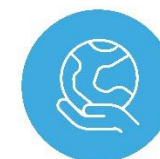
Cymru sy'n Fyd-eang Gyfrifol

Merthyr Tudful uchelgeisiol sy'n canolbwyntio ar ddysgu