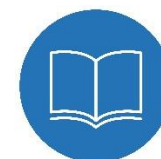
Cymru â Diwylliant Bywiog a'r Gymraeg yn Ffynnu